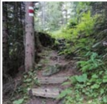
Neue Wegbauten zwischen der unteren Mettlen und Gschwantenmad.

Im August will die Gemeinde Schattenhalb auch den alten, direkten Weg von der „unteren Mettlen“ nach „Rufenen“ wieder herrichten. Die erforderliche Bewilligung vom Kanton liegt ebenfalls vor. (Wanderwegkommission Schattenhalb – Christine Kehrl)